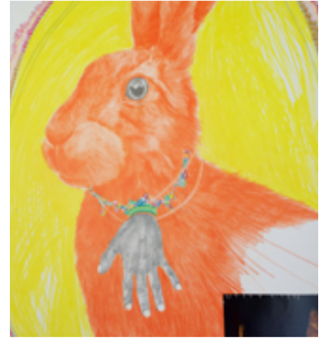
Verk laga av Brynhild Grødeland Winther.