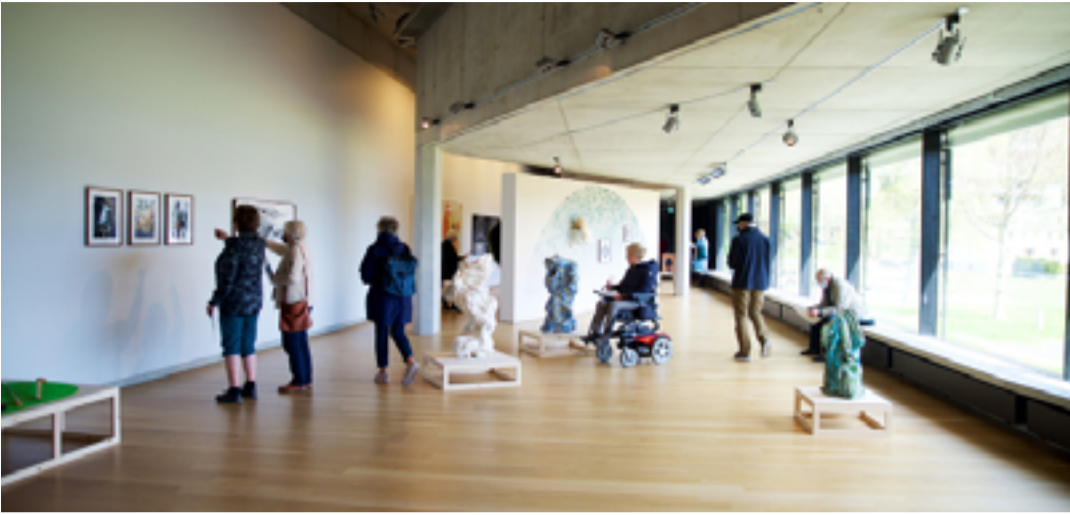
Frå opninga laurdag. Her ser me utstillingssalen.