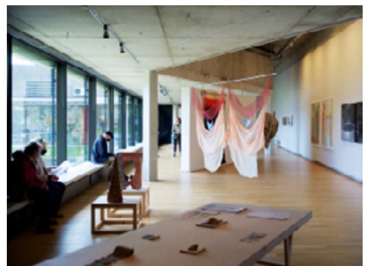
Vestlandsutstillingen feirar 100 år til neste år og er den eldste landsdelsutstillinga i Noreg.